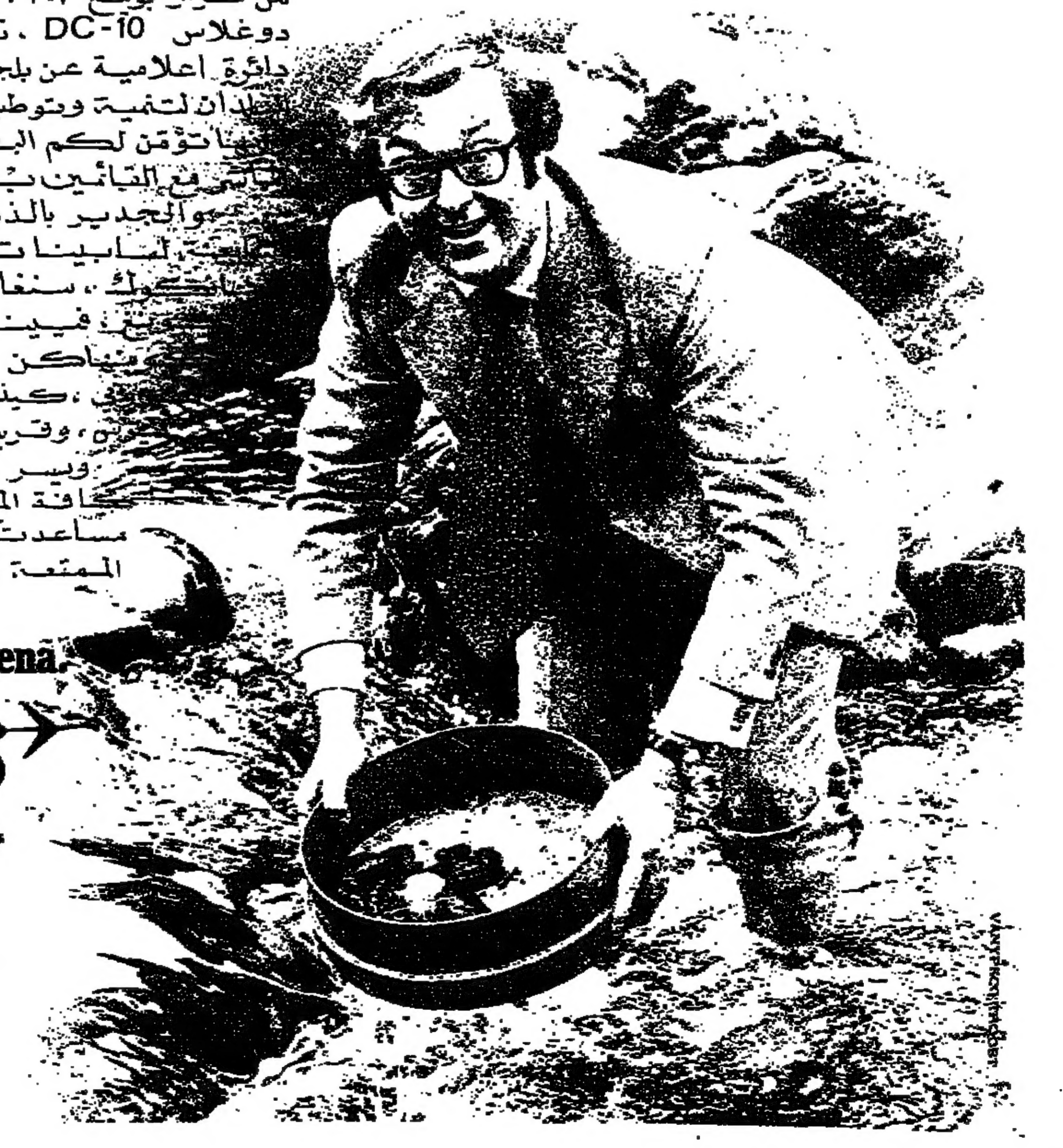
Go Belgian. Go Sabena. belgian world airlines

لاحتضاناً باعتراف ان عدداً كبيراً من الشركات الاجنبية قد اختارت بلجيكا مركزاً أساسياً لعملياتها بعد ان أصبحت بروكسيل عاصمة السوق الاوروبية المشتركة .